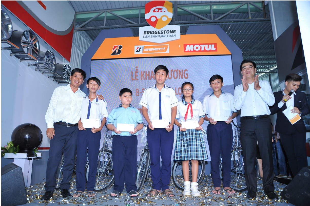
Đại diện B-select Vạn Lợi và đại diện khu vực trao học bổng cho các em học sinh

vé thu được (300.000đ/vé) sẽ được dùng để tặng cho các em học sinh hiếu học tại địa phương.