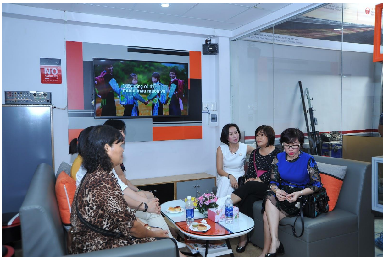
Phòng chờ rộng rãi với đầy đủ tiện nghi

Tất cả những nỗ lực của Vạn Lợi trong suốt 55 năm qua đã bắt đầu ra quả ngọt. Vạn Lợi giờ đây không chỉ là một doanh nghiệp “lão làng” mà còn là nhân tố góp phần thúc đẩy sự phát triển của thị trường lốp xe. Bên cạnh chuyện kinh doanh, Vạn Lợi mang cho mình trách nhiệm với cộng đồng và nhất là bảo vệ an toàn cho những ai ngồi sau tay lái.