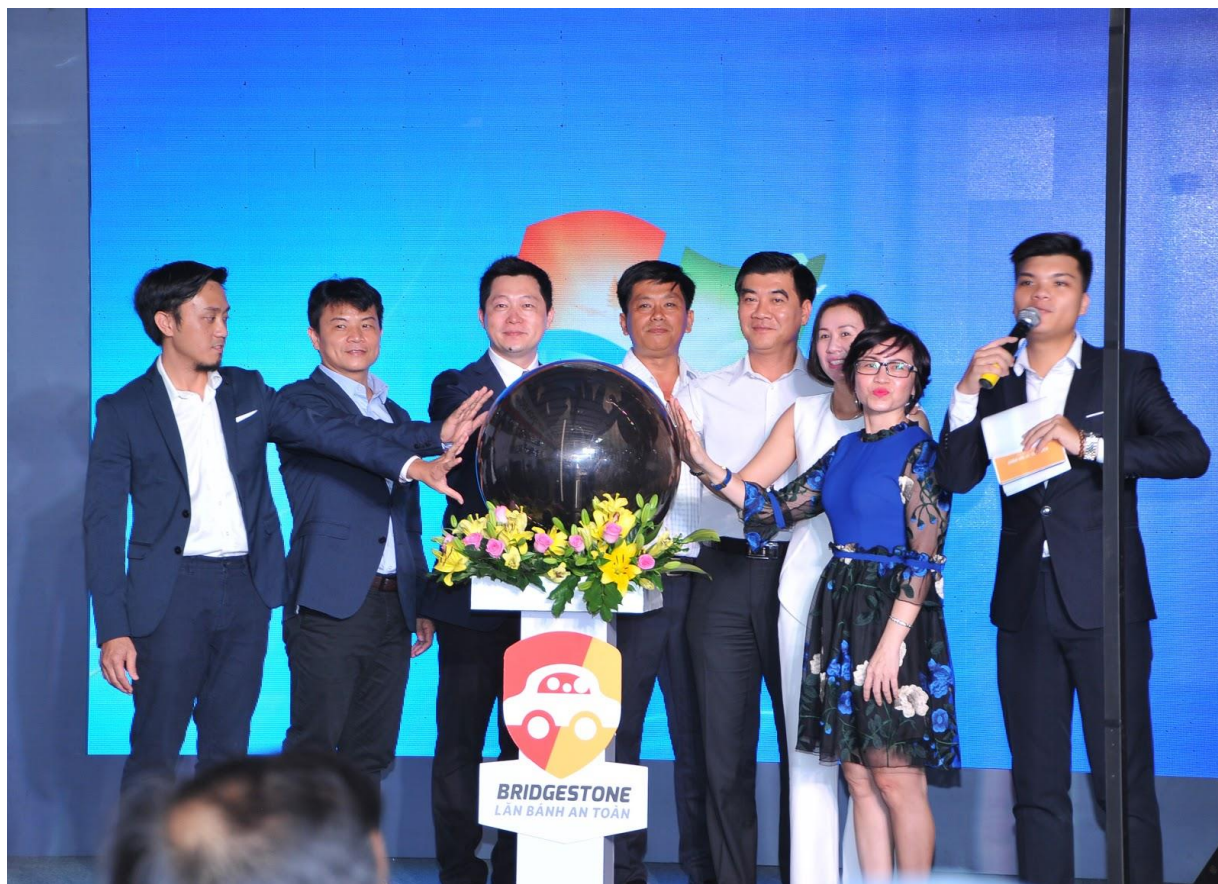
Đại diện Bridgestone, B-select Vạn Lợi và các đối tác trong ngày hợp tác

B-select là tên gọi của Trung tâm Dịch vụ Lốp xe Du lịch cao cấp của Bridgestone. Đây là một mô hình được Bridgestone nghiên cứu và phát triển nhằm mang đến những trải nghiệm chất lượng chuẩn quốc tế cho khách hàng khi sử dụng dịch vụ chăm sóc lốp và xe của Bridgestone.